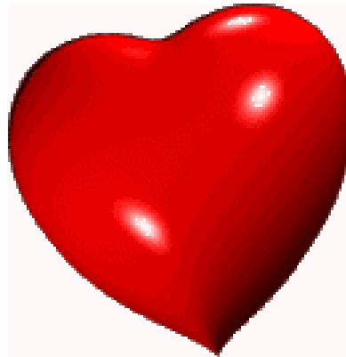
Das große rote Betzenherz.